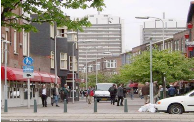
Geleenstraat Den Haag, overdag.